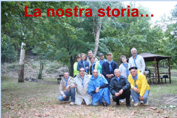
Parco S. Michele – Route e Promessa –